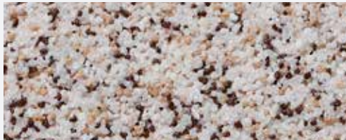
M 307 Bistra