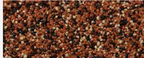
M 315 Rodna