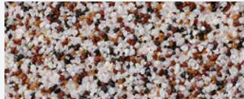
M 308 Kope

Ένα χαρακτηριστικό γνώρισμα των τελικών επιχρισμάτων MosaikTop είναι η ασυνήθιστη υφή τους που μοιάζει με μικρά βότσαλα. Η πρόσοψη είναι κομψή και φυσική. Η σύνθεση των τελικών επιχρισμάτων, που περιλαμβάνει οργανικά συνδετικά και χαλαζιακή άμμο, προέρχεται, επίσης, από τη φύση.