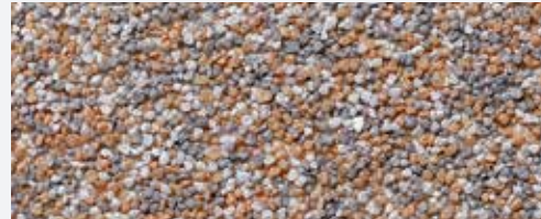
M 302 Monviso