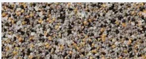
M 326 Triglav