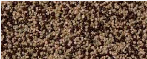
M 318 Rax