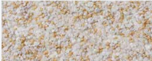
M 301 Albaron