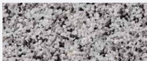
M 329 Cristallo