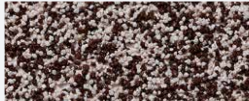
M 306 Parnass