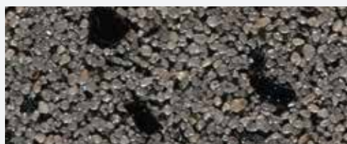
M 342 Everest