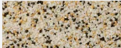
M 325 Bellavista

Το χρώμα της πρόσοψης ελκύει την προσοχή ακόμη και από απόσταση, καθώς είναι ο πρώτος παράγοντας που γίνεται αντιληπτός σε ένα κτίριο. Η έγχρωμη χαλαζιακή άμμος σε ειδικά επιλεγμένες αποχρώσεις, που χαρακτηρίζουν το τελικό επίχρισμα Baunit MosaikTop, δίνουν την ευκαιρία δημιουργίας διαφορετικών αποτελεσμάτων στην πρόσοψη, ενώ το χρώμα τους θα παραμείνει ζωντανό για πολλά χρόνια.