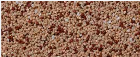
M 305 Victoria