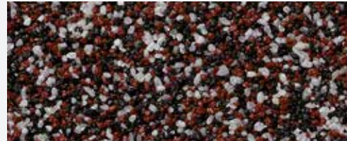
M 313 Athos