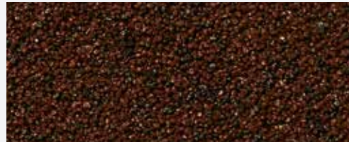
M 317 El Capitan