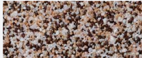
M 304 Denali