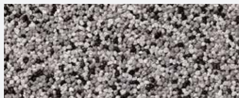
M 327 Rushmore