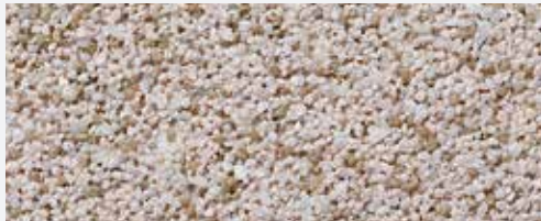
M 303 Matterhorn