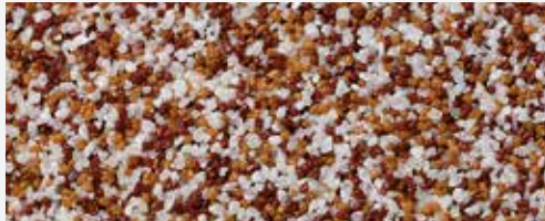
M 312 Cook