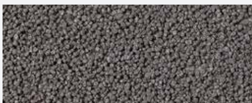
M 330 Elbrus