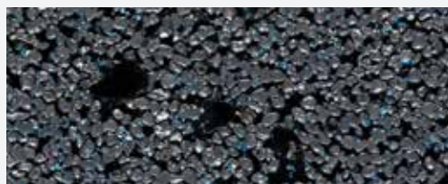
M 343 Etna