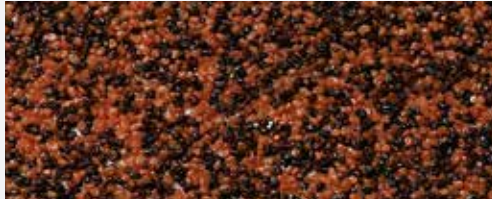
M 314 Ararat