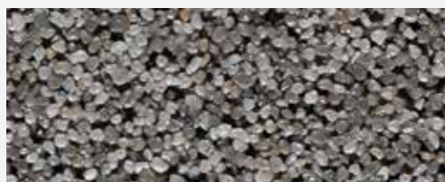
M 341 Rocky