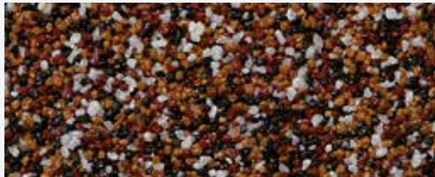
M 316 Kosh